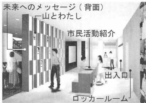
1階エントランス「新・対山館サロン」展示改修イメージ図

(2)「北アルプスの自然」(2階) 46億年という悠々の歴史をたどってきた奇跡の惑星「地球」の成り立ち、地球の歴史からするとわずか2000万年という短い歴史ですが、この地の地質構造を考えるには不可欠なフォッサマグナについて展示を行います。また山岳都市「大町」及び北アルプスの成り立ちについて学ぶことができるよう、地質の分野を大幅に拡充致します。 また北アルプスとその周辺の生物の展示では、カモシカのコーナーを充実し、生活の様子を紹介するとともに、ニホンジカとの違いや、体のつくりについても、小学校の授業での教材になるような構成にしております。 ライチヨウは高山生物の象徴とらえ、生活や不思議を感じていただけるよう、ミニジオラマや最新の研究情報コーナーを充実してまいります。