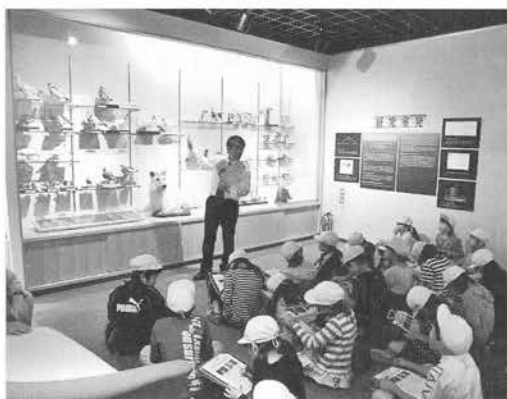
市内小中学校との連携・融合授業

これらを行うために国や県をはじめとする大学や研究所・博物館・動植物園など、国内外の機関と連携した活動を展開するとともに、地域の情報を取り入れて市民との協働の活動を推進してまいります。