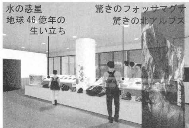
2階常設展示室「北アルプスの自然—水の惑星(地球) 46億年の旅」ほか展示改修イメージ図

を順次進めてまいりたいと考えております。 6 新しい常設展示の紹介 常設展示のメインテーマは「北アルプスの自然と人」と致しました。「自然と人が共生する山岳文化」を博物館からのメッセージとします。 (1)「あなたと山のかかわり」(3階) 眼前に広がる北アルプスの雄大なパノラマ風景をゆったりと楽しんでいただき、展示主体で取り扱う内容の導入とします。