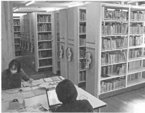
山岳図書資料館内での図書資料整理事業風景

① 早速に記録にとどめ、保存が必要と考えられる資料を最優先に収集し、記録・整理をおこない、山岳博物館における情報発信の核とします。