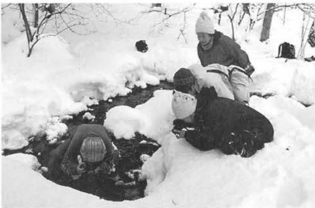
湿地植物の生活史研究グループの活動

北アルプスとその山麓地域の自然や文化に関する情報発信の核となるよう、また、教育普及活動に活用できるよう、博物館で取り扱うことから定めて、それに沿った資料情報の収集・整理、保管をさらに充実させ実施してまいります。