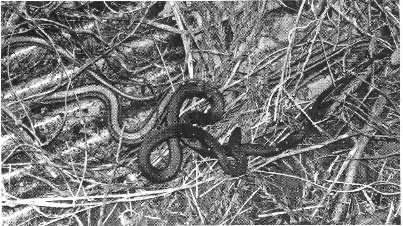
シマヘビの黒化型と普通型（撮影地：白馬村神城佐野の畑の畦） 平成12年5月17日撮影