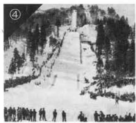
写真4 第23回スキー国体大会ジャンプ会場

※掲載した写真1〜4はすべて、白馬・山とスキーの総合資料館発行の「白馬スキー伝来100年のあゆみ」より転載いたしました。