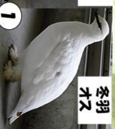
ニホンライチョウ