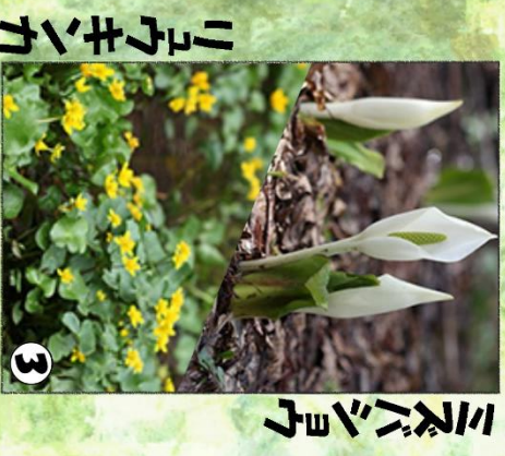
シロバナショウリウソウ