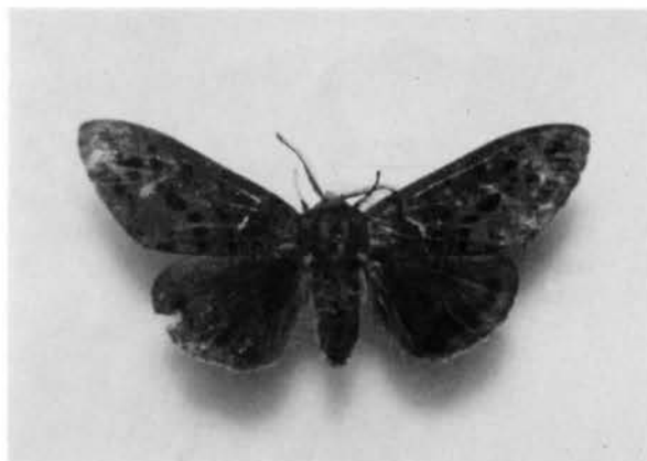
写真4. クワゴマダラヒトリの雄

ワフタギにもみられた。満は毛をつぶつてつくられ、このなかでさなぎになる。成虫（蛾）は、雌と雄とは、まったく異なっている。すなわち、雌ははねの色が黄白色であるのに対し、雄のはねは淡黒色である（写真3、4）。 ザゼンソウもミスバシヨウもともに毒草であるが、これらの葉を与えて飼育した数個体は正常に羽化した。ただし、すべて雌であった。