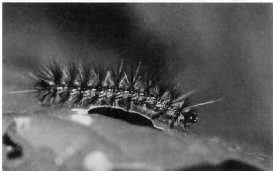
写真1. クワゴマダラヒトリの幼虫 1998.6.2 ザゼンソウの葉上

一九九八年六月二日、大町市の居谷里湿原の巡視を行った際に、ザゼンソウの葉上におびただしい数のクワゴマダラヒトリ（ヒトリガ科）の幼虫を確認した。ミスバシヨウの葉にもついていたので、観察したところ、盛んに摂食しているのが確認された。クワゴマダラヒトリは、古くから桑の害虫として知られ、クワノゴマダラチョウと呼ばれた。また、若齢時代には巣をつくって群棲するところから「桑の巣虫」などとも呼ばれた。老熟幼虫（写真1）は、体長が四五mmもあり、体には橙黄色や青色のいぼがあつて、ここから黒色や白色の長毛が生えているので種類の判定は容易である。 この毛虫は雑食性で、クワ以外のいろいろな植物につく。ザゼンソウやミスバシヨウのほかにもノリウツギやサ