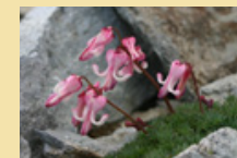
当館のコマクサ園の見どころは 5月中旬～6月下旬