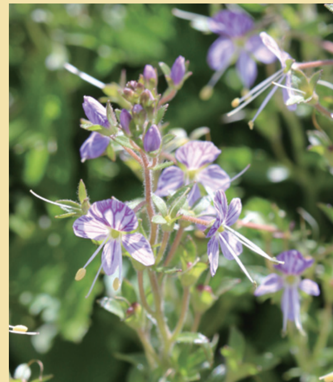
高山植物「ミヤマクワガタ」